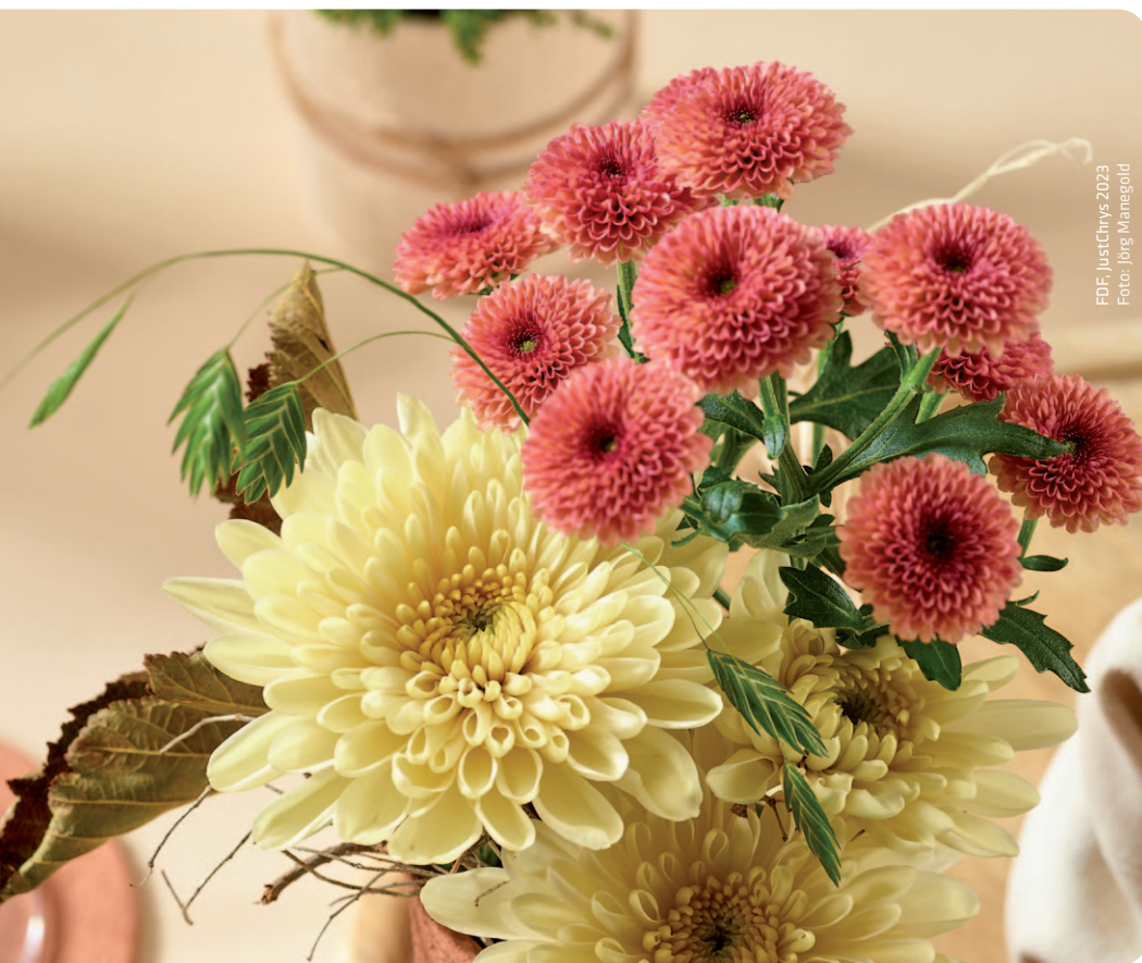
PDF, JustChrys 2023