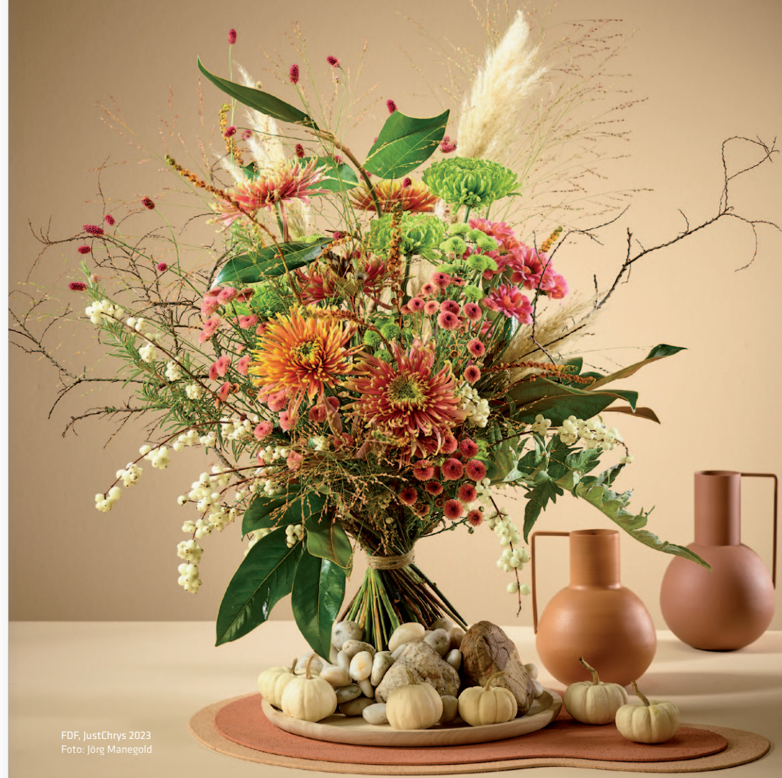
FDF, JustChrys 2023

Besuchen Sie uns auch unter www.fdf.de und auf