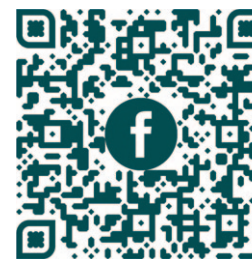
FDF Florist-Meisterschule auf facebook